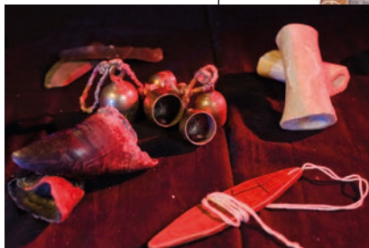
Några forntida ljudverktyg